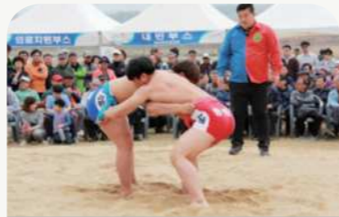
청산생선국수와 함께하는 민속씨름대회(4.13.~4.14.)