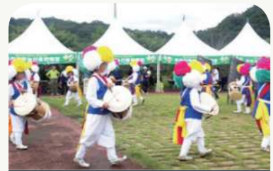
옥수수과 감자의 만남 축제 (7.14.~7.15.)