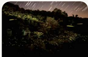
안터마을 반딧불이축제 (5.25.~6.9.)