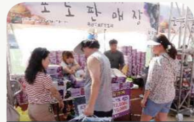
향수옥천 포도·복숭아축제 (7.26.~7.28.)