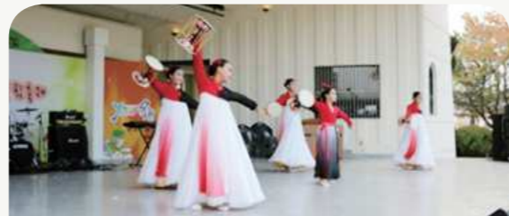
옥천 행복 어울림 축제(10.13.)